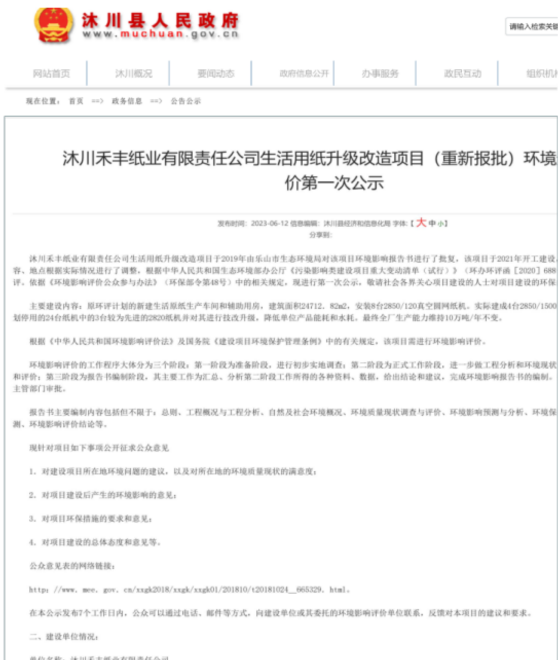
图 2.2-1 本项目第一次公示截图

本项目建设地点在乐山市沐川县工业园区（禾丰纸业公司已征用地和永丰纸业公司预留用地范围内），通过沐川县人民政府网站进行了第一次网络公示，该网站为对外公开是易于公众接触和阅读的网站。网址为： http://www.muchuan.gov.cn/mcx/gggs/202306/d22752cea15144868f477265ae73bb53.shtml ，以下为公示截图。