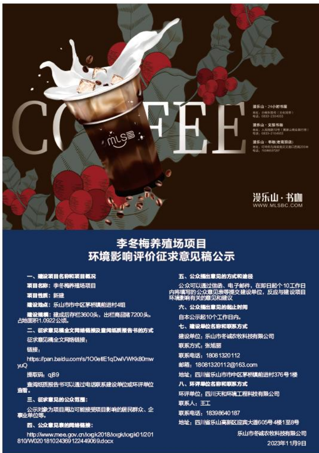
图 3-2 项目第一次登报照片