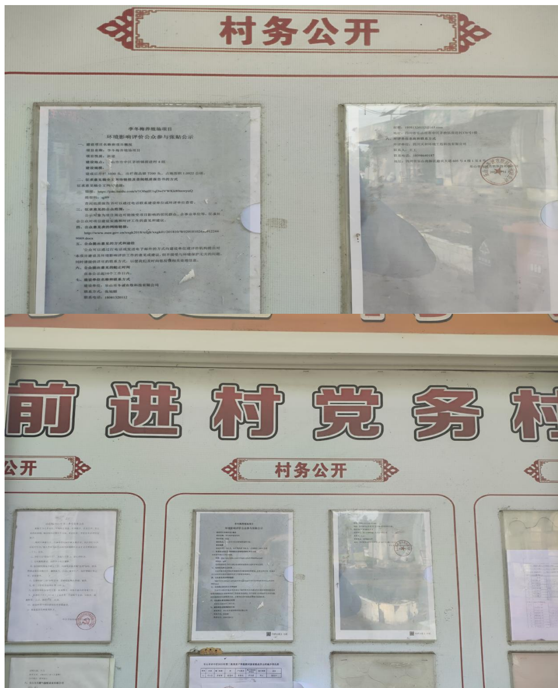
图 3-4 项目张贴公示照片

为进一步告知当地群众，加深其对项目的了解，在本项目征求意见稿公示期间，在项目所在地茅桥镇前进村公示栏上张贴了项目的公示信息，张贴公示时间：2023年11月7日起，共10个工作日，张贴公示地点是公众易于接触的场所，此次张贴公示区域选取符合《环境影响评价公众参与暂行办法》的要求。