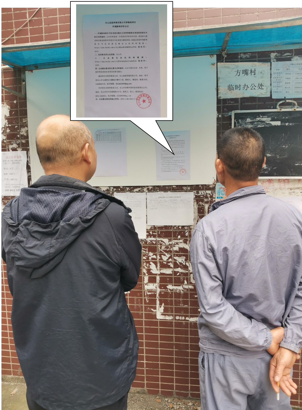
图 3-4 公示照片

本项目位于乐山市五通桥区石麟镇方嘴村。本项目在公示期间，同时采取了张贴公告公示，公告张贴在石麟镇方嘴村信息公示栏上，张贴时间为2023年11月8日，此次张贴公示区域选取符合《环境影响评价公众参与办法》的要求，张贴照片见下图：