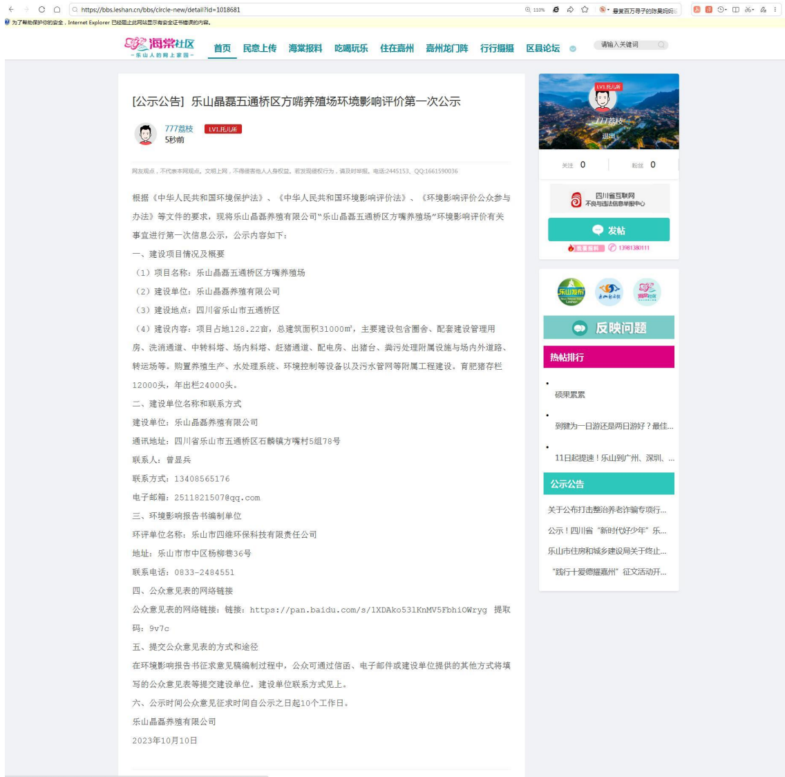
图 2-1 项目第一次公示网络公开截图