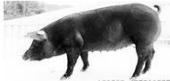
山下黑猪,《江西农业大学学报》

选育了4个具有代表性的中国本土猪种,与3个引进猪种开展杂交试验,筛选出最佳杂交组合,开展杂交后代生产性能测定和肉品质测定试验,最终选育出了“山下黑猪”新品种。该品种具有体型大、肉质好、易饲养、产肉量高等特点,且抗病力强,适应性强,是我国黑猪育种的重要突破。