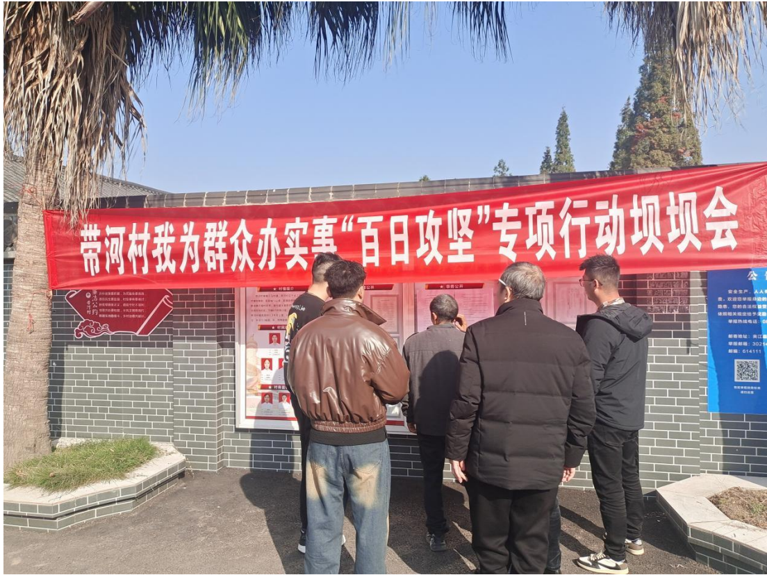
图 3-7 项目张贴公示照片