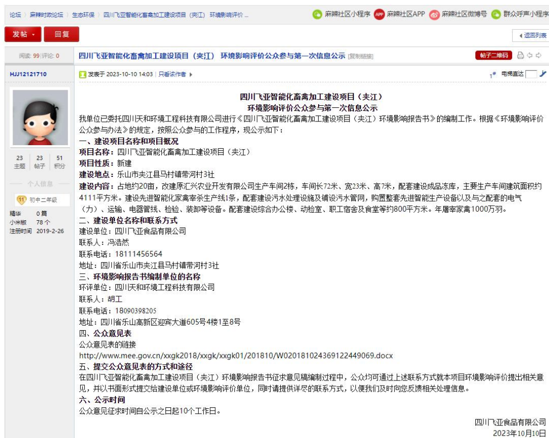
图 2-1 项目第一次公示网站公示截图

网址： https://bbs.mala.cn/thread-16545850-1-1.html