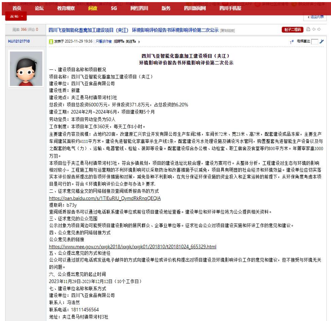
图 3-3 项目第二次网上公示截图