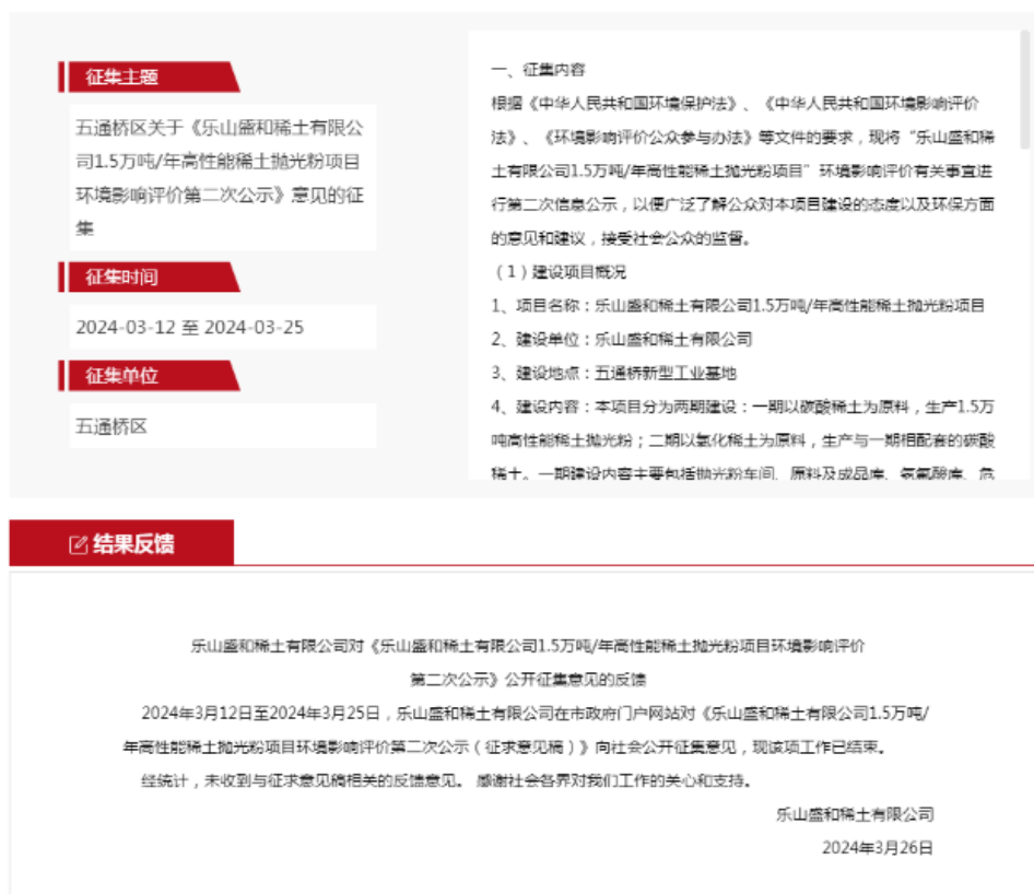
图 3-1 第二次网上公示截图