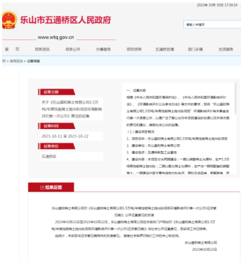
图 2-1 项目第一次公示网络公开截图

本项目于 2023 年 10 月 11 日在乐山市五通桥区人民政府网站（ http://www.wtq.gov.cn/wtqq/zjdcwtq/zjdccontent.shtml?id=ff8080818ab72a71018b1c598e30026c ）上进行了第一次信息公示，公开内容见下图：