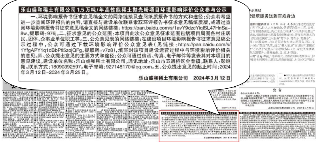
图 3-2 征求意见稿第一次登报公示照片