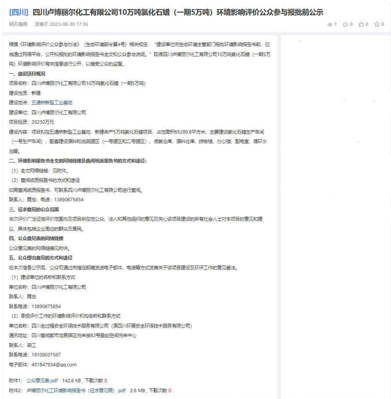
图4.2-1 报批前网络公示截图