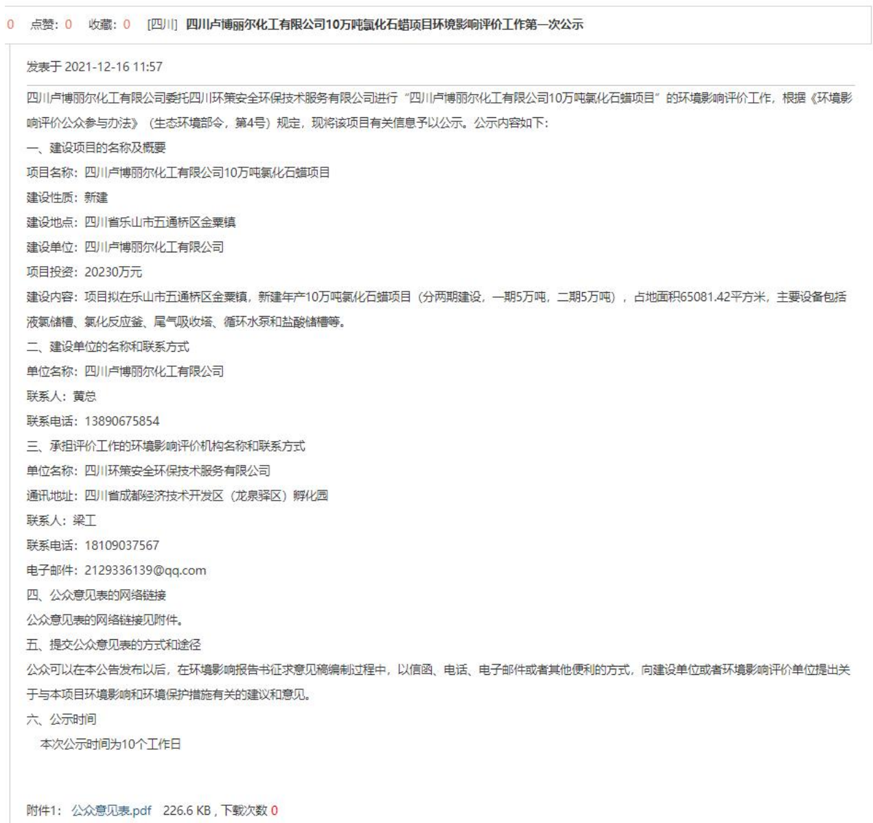
图2.2-1 第一次网络公示截图