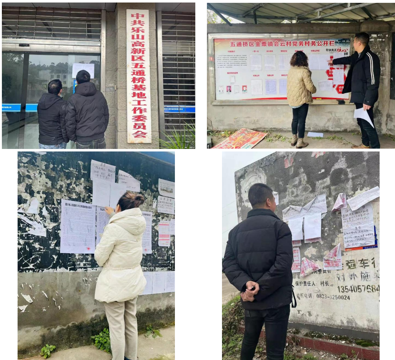
图3.2-4 公示栏张贴公示